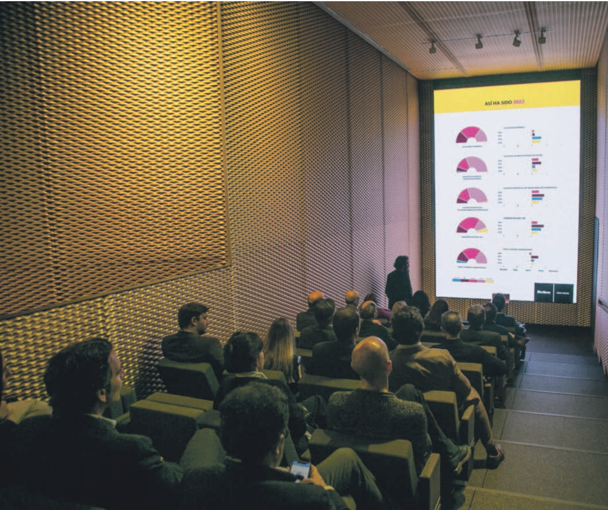
Imagen de la presentación del Observatorio Retina 2023 en el Espacio Solo de Madrid. SANTI BURGOS