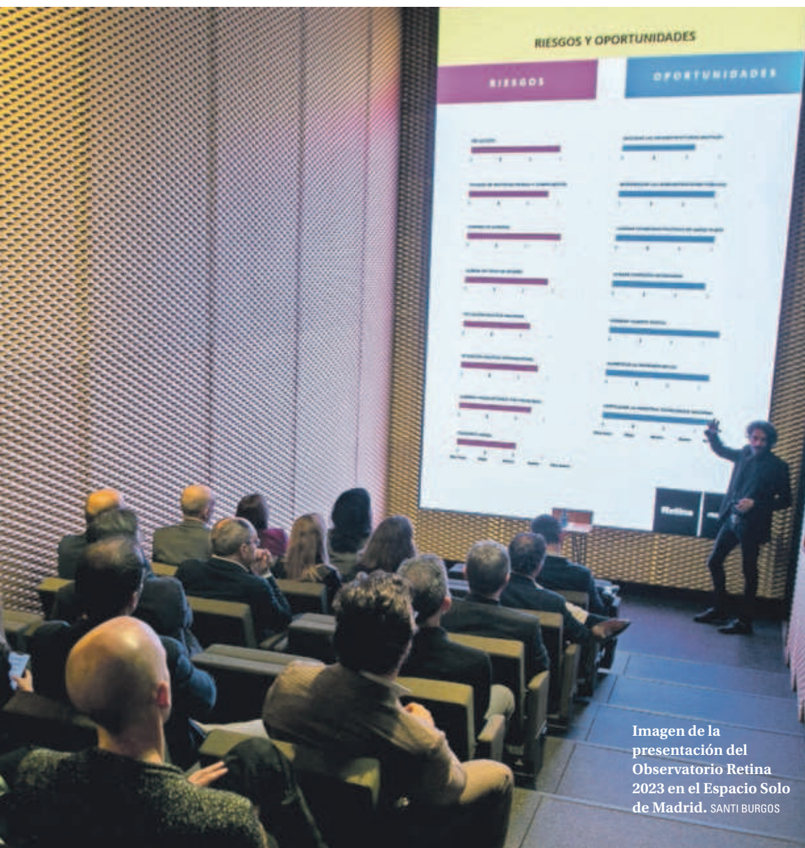
Imagen de la presentación del Observatorio Retina 2023 en el Espacio Solo de Madrid.